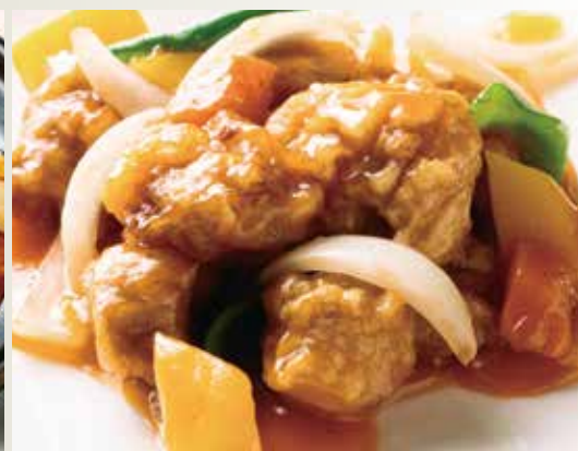
◆ジューシー酢豚 780円