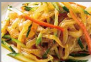
◆ クラゲの冷菜 780円