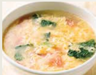
◆ トマト玉子スープ 480円