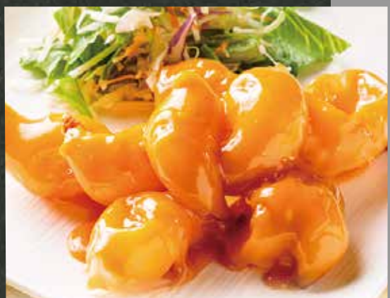
◆ 海老のマヨネーズ炒め 880円