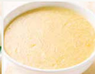
◆ コーンスープ 480円