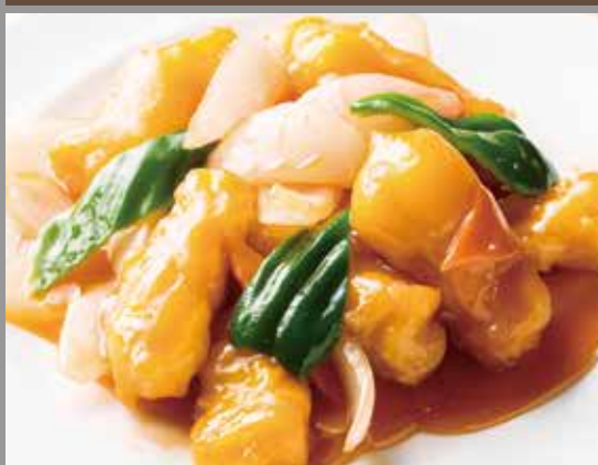
◆ 白身魚の甘酢炒め 780円