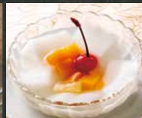
◆ 特製杏仁豆腐 380円