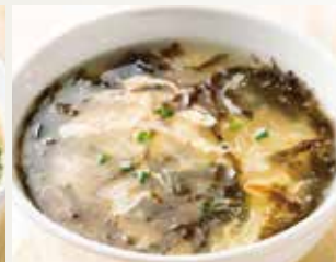
◆ 海苔スープ 480円