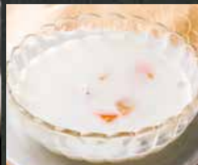
◆ タピオカココナツ ミルク 380円