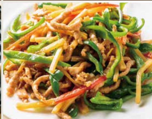
◆青椒肉絲 (チンジャオロース) 680円