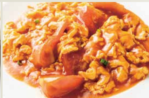
◆ トマトとふわふわ玉子炒め 680円