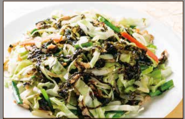
◆ヘルシー福建岩のりとキャベツ炒め 580円