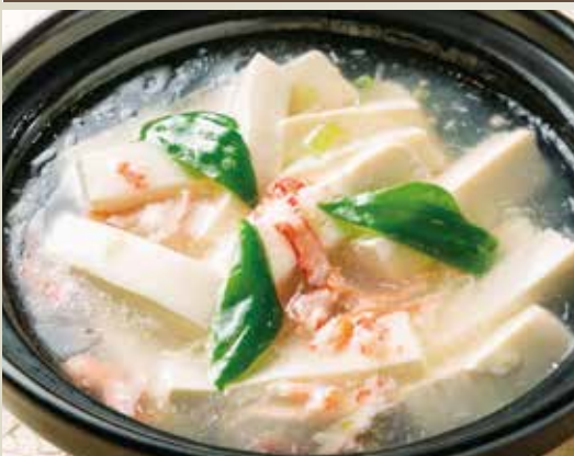
◆カニ身豆腐の広東煮 680円