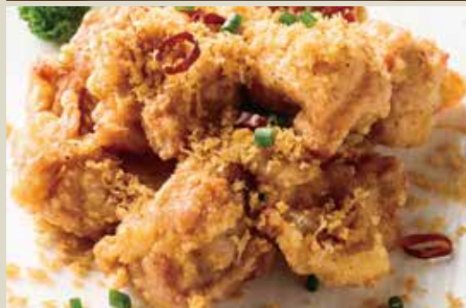
◆ 鶏肉ガーリック唐揚げ 680円