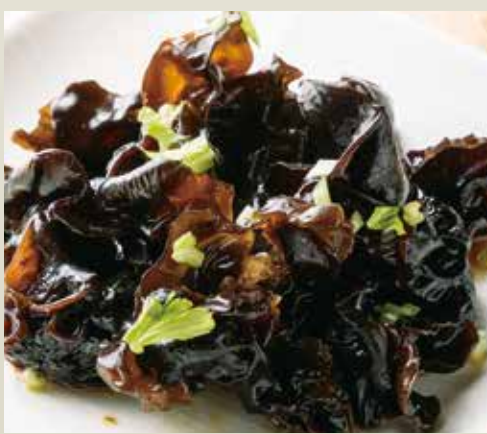
◆ きくらげ冷菜甘酢風味 480円