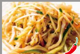
◆ 豚耳冷菜 380円