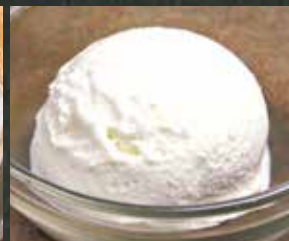
◆ バニラアイス 380円