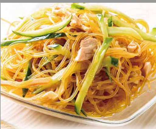
◆ 春雨サラダ 580円