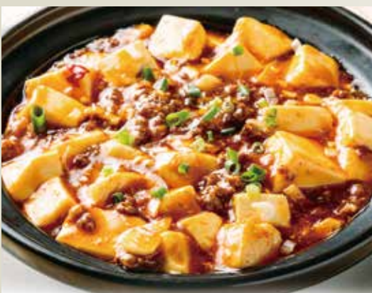
◆まるやか広東麻婆豆腐 580円