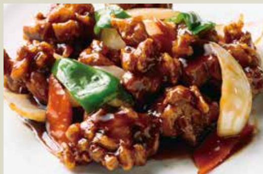
◆ 鶏肉の黒酢炒め 760円