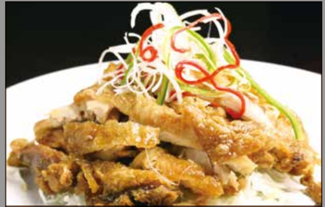
◆揚げ鶏香味ソースかけ 580円