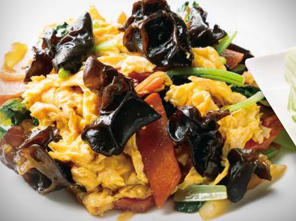
◆ 玉子ときくらげ炒め 680円