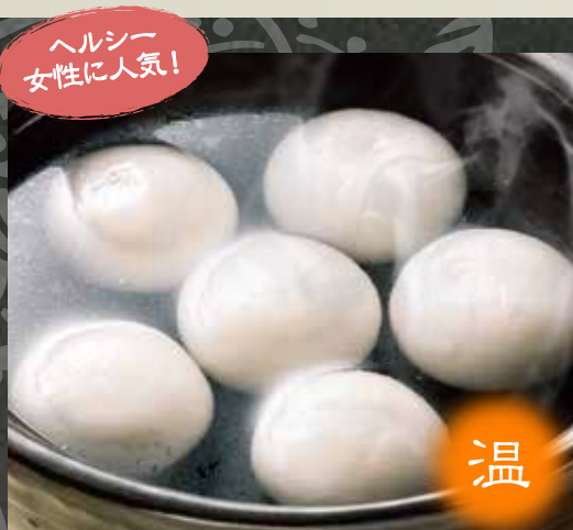
◆ 福建湯団子 (黒ごまあん入り) 580円