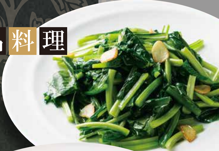
◆ 青菜炒め (季節によって異なります) 680円