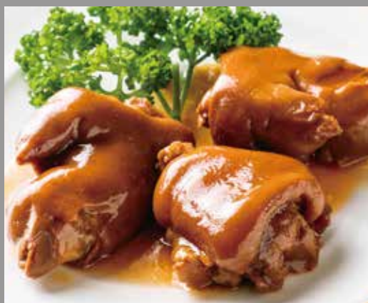
◆ やわらか豚足醤油煮込み 480円