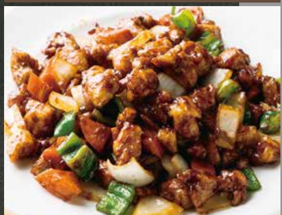
◆ 鶏肉味噌炒め 780円