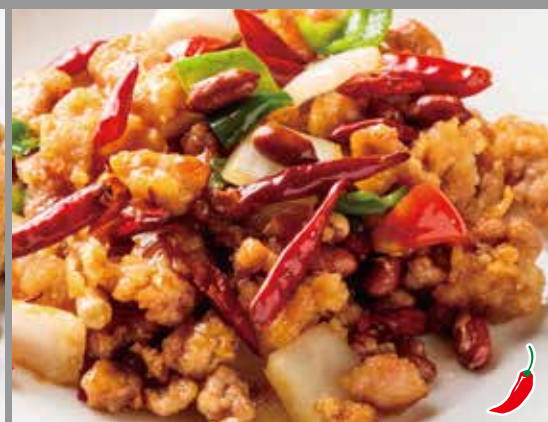
◆ 鶏肉の四川風ピリ辛炒め 780円