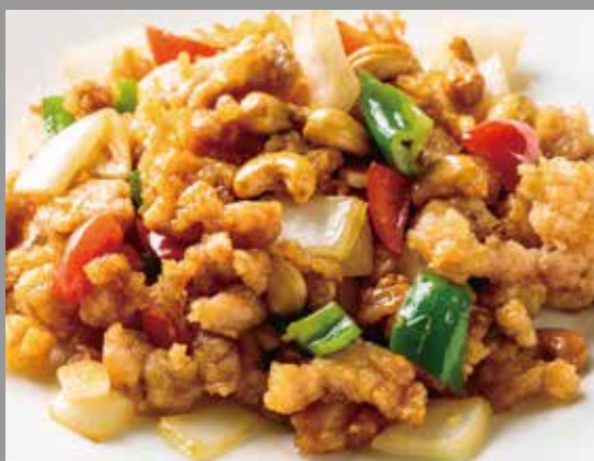
◆ 鶏肉とカシューナッツ炒め 680円