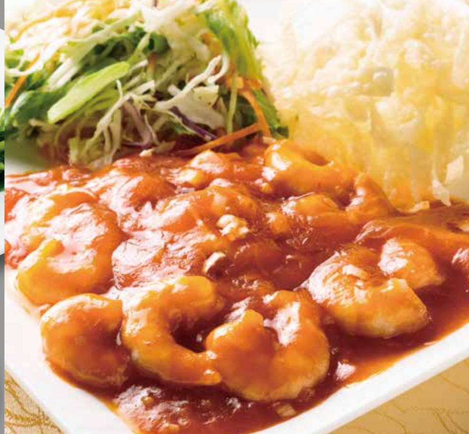
◆ プリプリ海老チリソース 780円