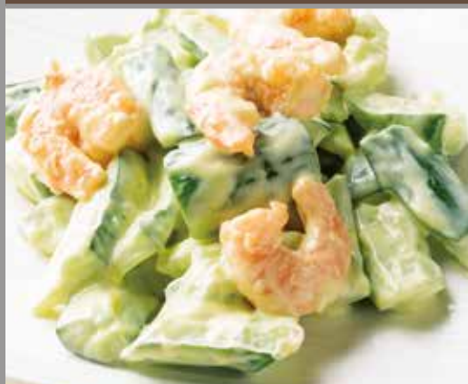
◆ 海老と胡瓜の辛子マヨ和え 580円