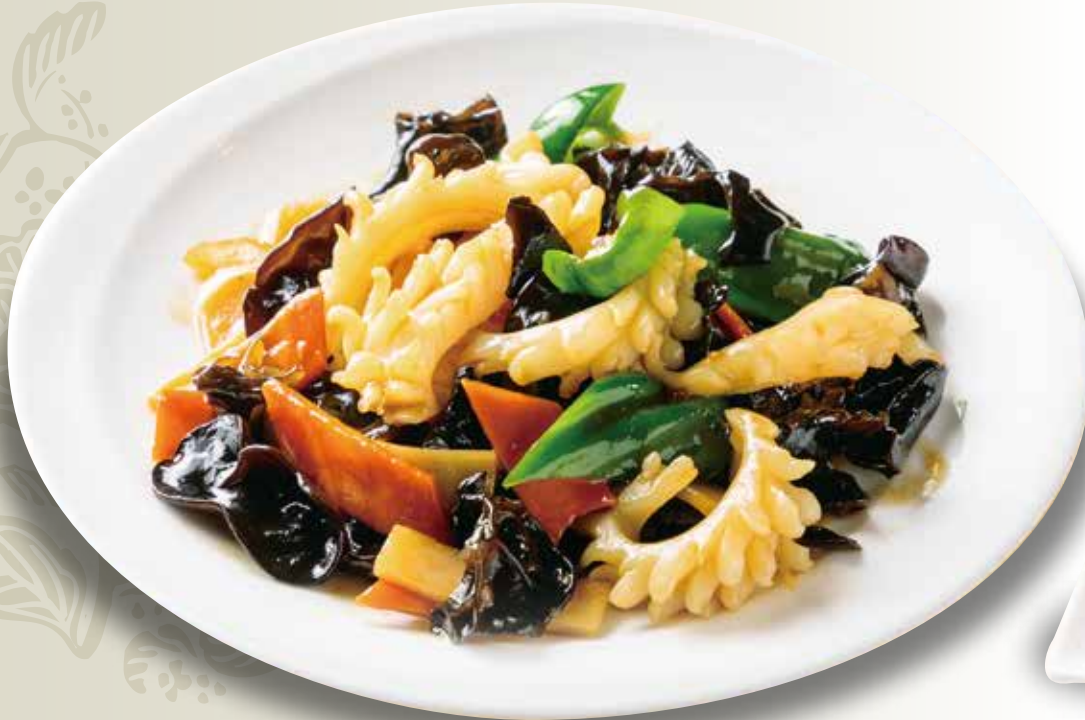
◆イカときくらげ炒め 780円