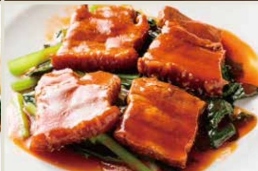
◆ 特製豚の角煮 780円