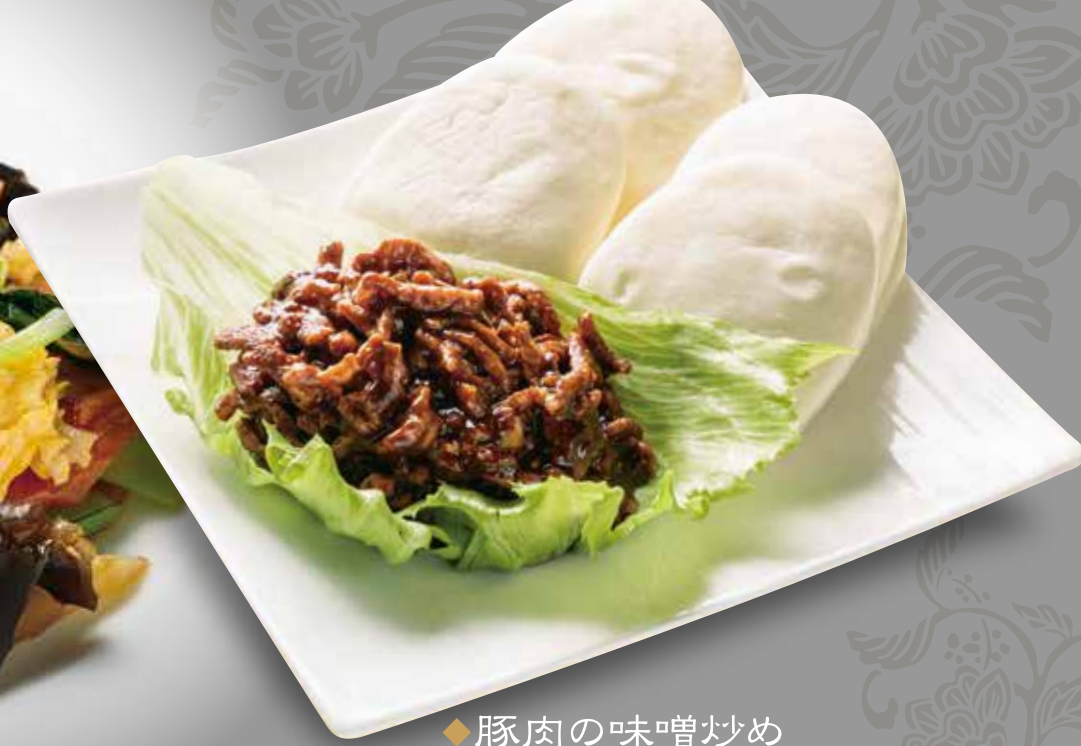
◆ 豚肉の味噌炒め 蒸しパン包み 880円