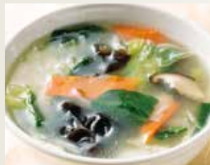
◆ 野菜スープ 480円