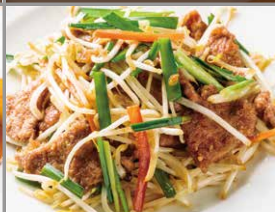
◆ 柔らかレバニラ炒め 680円