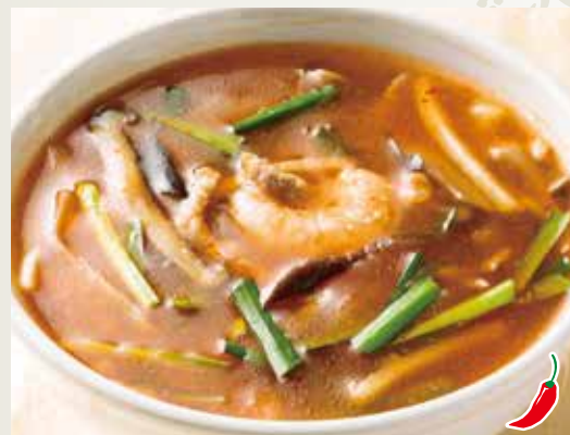
◆ 酸辣湯 (サンラータン) 480円