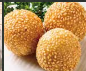
◆ ごま団子 380円