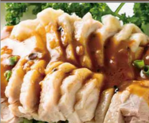
◆ バンバンジー 660円