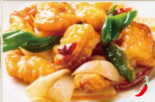
◆ 白身魚の辛味炒め 780円