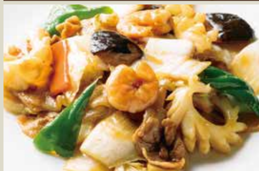
◆ 八宝菜 780円